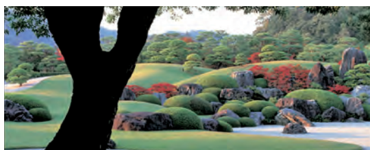
▲ 四季の庭園 足立美術館 (安来市)