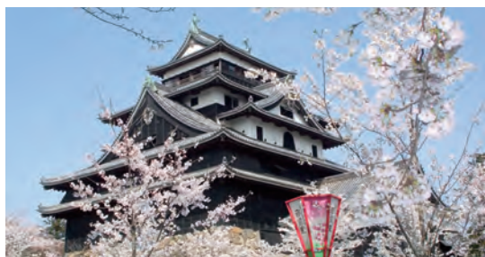
▲ 正統天守閣誇る松江城

「緑の道」のルートは鳥取県東部から島根県西部と、隠岐までの行程から成り立っている。天然記念物の鳥取砂丘や出雲大社、国宝の松江城などの観光地に加えて、日本屈指の紅葉の大山や日本遺産に認定された奥出雲の「たたら」、大絶壁『摩天崖 (まてんがい)』の隠岐の島国賀海岸、アメリカの日本庭園専門誌『ジャー