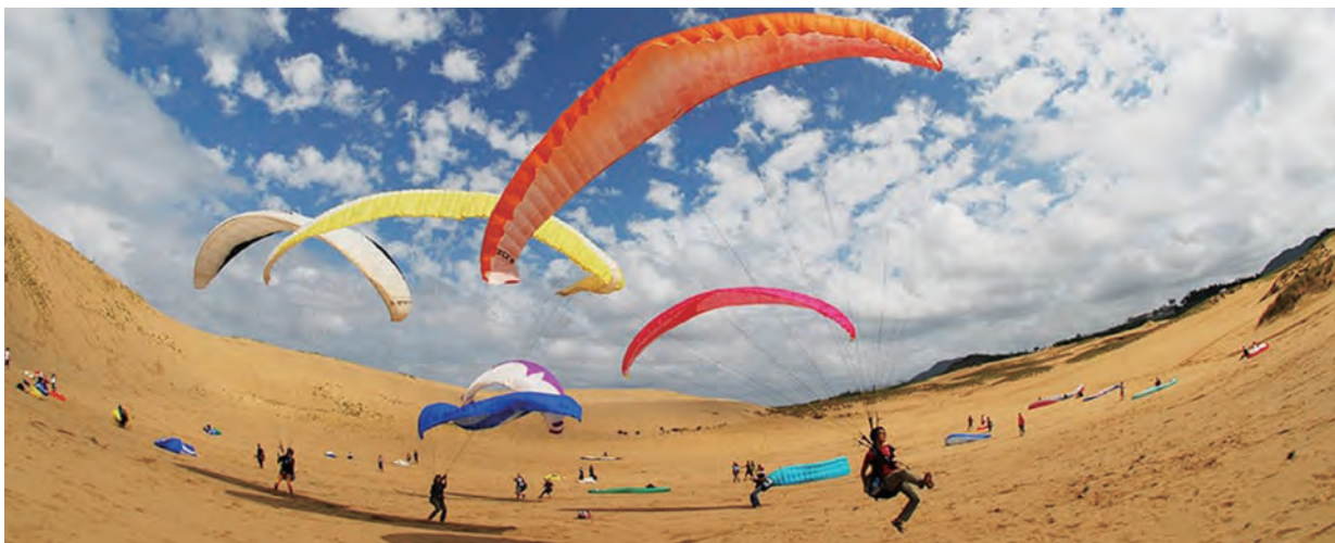
▲ 鳥取砂丘でパラグライダーを体験