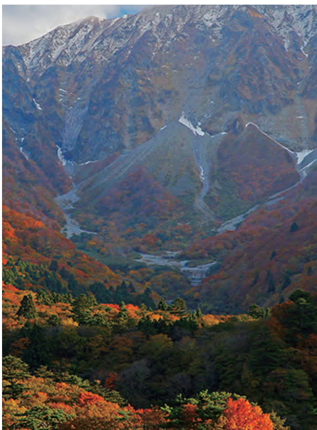
▲ 紅葉に魅せられし大山